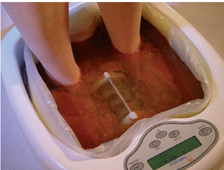
Abbildung 2: nach 30 Minuten